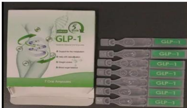
Croaie Tipoleptide GLP-1 + GIP Weight Management