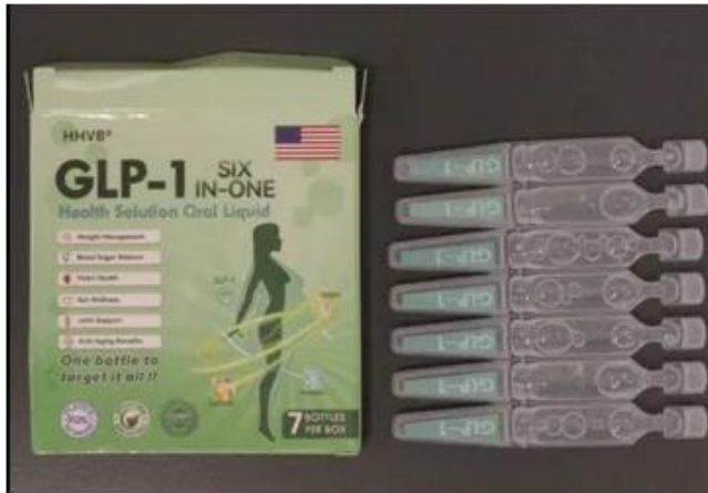
EQVP GLP-1 Six In-One Health Solution Oral Liquid