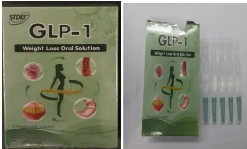
BuildLeaf - Tirzepatide GLP-1 Herbal Oral Liquid